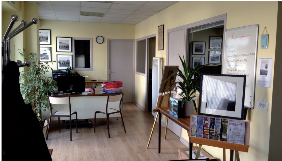
L'accueil du 54 rue Pierre et Marie Curie à Limoges.