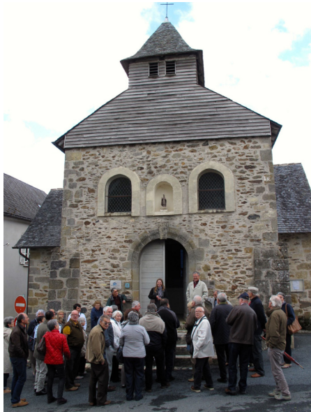
Chapelle Saint Blaise, ancienne chapelle des officiers des Haras