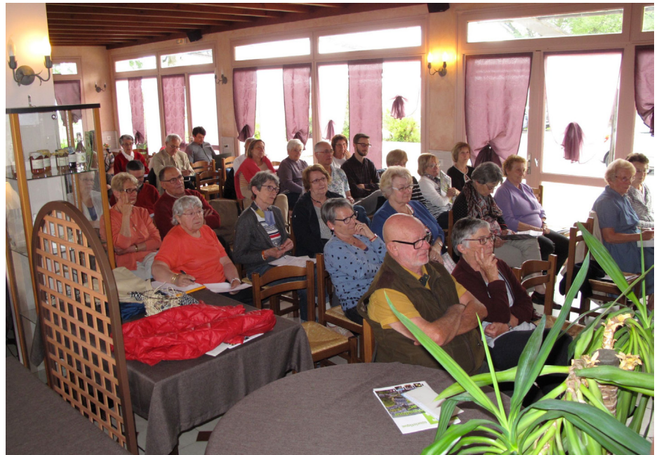
Après un délicieux repas, place à l'assemblée générale.