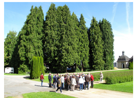
Visite des jardins du château de Pompadour.