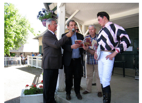
Remise du Prix du Cghml au vainqueur de la troisième course.