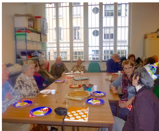
Galette du 16 janvier 2018 au local du Cghml.

Nous vous attendons aux permanences des 3 es mardis du mois (14h-17h) : 17 avril, 15 mai et 19 juin, ainsi que le samedi matin 9 juin