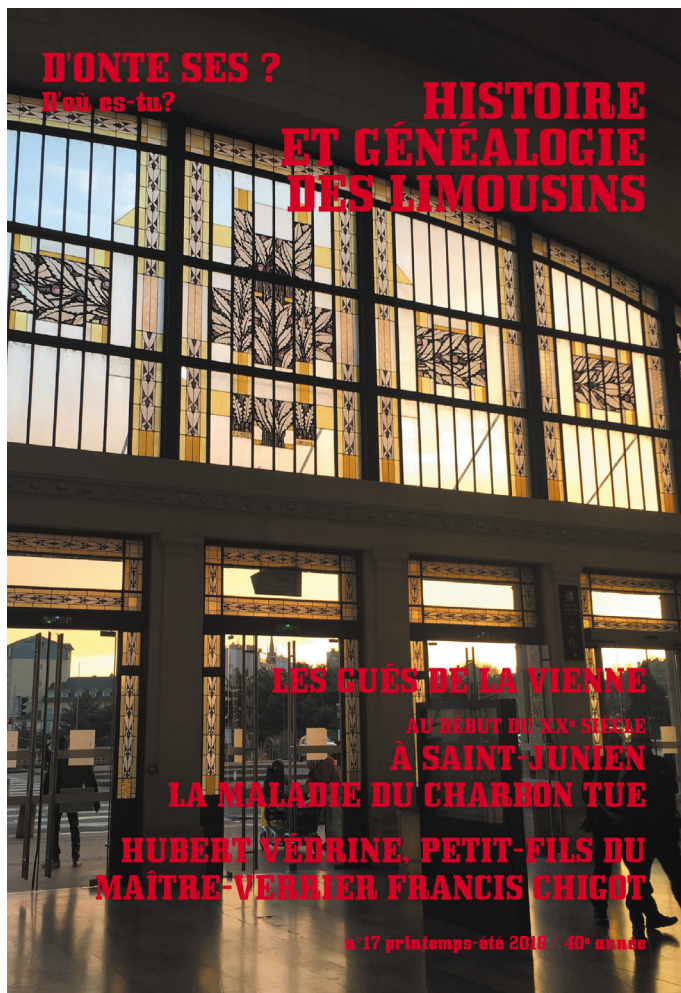
La revue du Cercle de généalogie et d'histoire des Marchois et Limousins