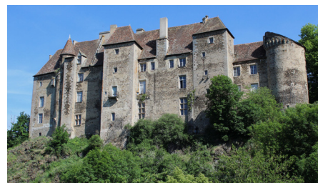
Château de Boussac.

4) Recherche d'une filiation par la génétique : l'analyse de sang est autorisée en Angleterre, mais pas en France. Il y a une possibilité par internet à l'étranger. Des articles ont déjà été proposés au Cghml, pour l'instant reportés.