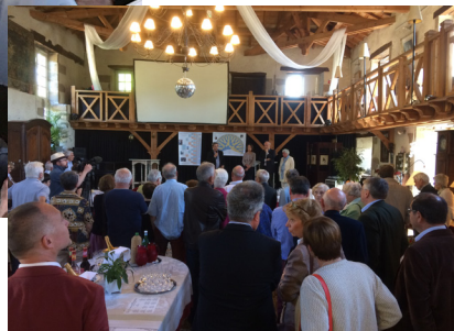
© C. Régnier, G. Barelaud, O. Terracol