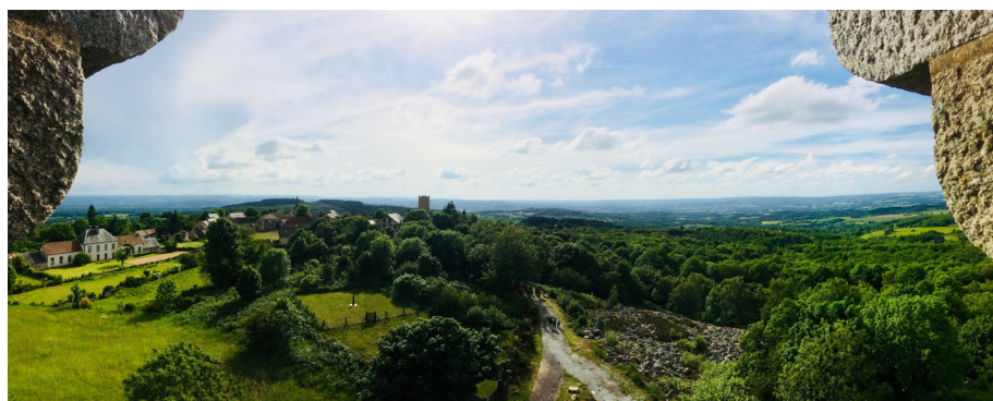
Panorama du village depuis la Tour de Toulx-Sainte-Croix.