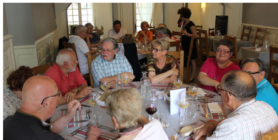
Dîner convivial au restaurant Le Central à Boussac

L'ordre du jour étant épuisé, la séance est levée le 2 juin 2018 à 16h45.