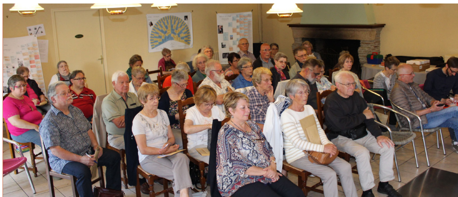
C'est à Boussac en Creuse que se tenait la 39 e Assemblée générale.

petites touches d'intéresser le plus de personnes possibles aux diverses facettes de la généalogie.