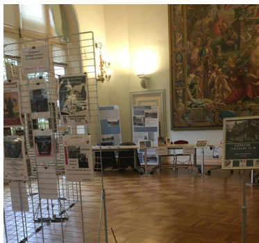
Le stand du Cghml dans les salons de la préfecture de la Haute-Vienne.

Bien sûr, les permanences fonctionnent toujours bien.