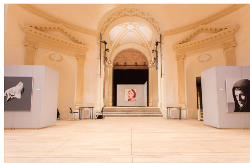
Vue intérieure de la Chapelle de la Visitation dans laquelle se tiendra le Cabinet de curiosités généalogiques et historiques du Limousin organisé par le Cghml et les AD 87.

Vous trouverez notamment, un cabinet de curiosités consacré aux institutrices d'Oradour-sur-Glane, leurs généalogies et leurs dossiers de l'éducation nationale conservés aux AD. Mais aussi, les maçons de la Creuse, les papetiers de la vallée de la Vienne, les bouchers de Limoges, les négociants de Meymac près Bordeaux, les congrégations de Limoges, les dépôts de chevaux de l'armée à Saint-Junien et les Haras nationaux de Pompadour.