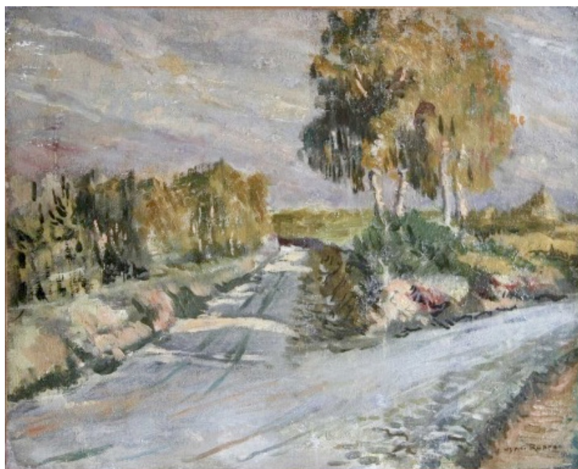
La croisée des chemins , d'Henri Robert. École du 20 e siècle. Galerie les Atamanes

Vous le savez, nous avons évoqué ce sujet dans la lettre de juin, notre Cercle est dans une situation financière très difficile.