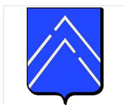
Fig. 4 bis