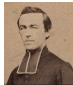
Ecclésiastique français, vers 1880.

www.siv.archives-nationales.culture.gouv.fr/siv/IR/FRAN_IR_059907