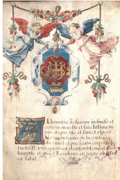
Ci-dessus « livre de recettes et de mises de la confrerie de la feste Dieu establee dans l'église Saint Pierre du Queyroy de Limoges », manuscrit sur parchemin écrit en français a été produit par l'une des confréries, communauté de laïques la plus riche de Limoges.