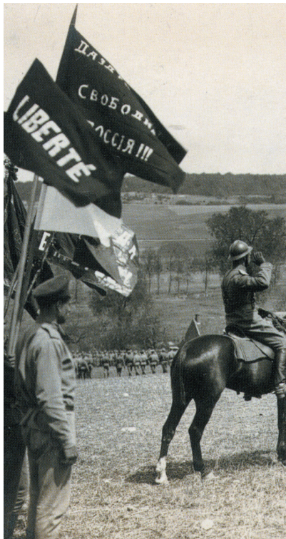
Ci-dessus : Malgré les tentatives des états majors de mettre au pas les soldats russes de La Courtiene, ceux-ci arborent des banderoles revendicatives en français et en russe.